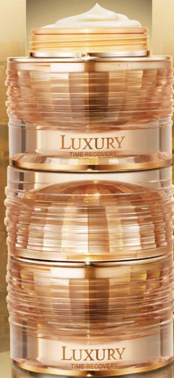
라비다 럭셔리 타임리커버리 아이크림 [주름개선 · 미백 기능성] 25ml / 280,000원